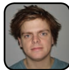
af Pelle Ammundsen